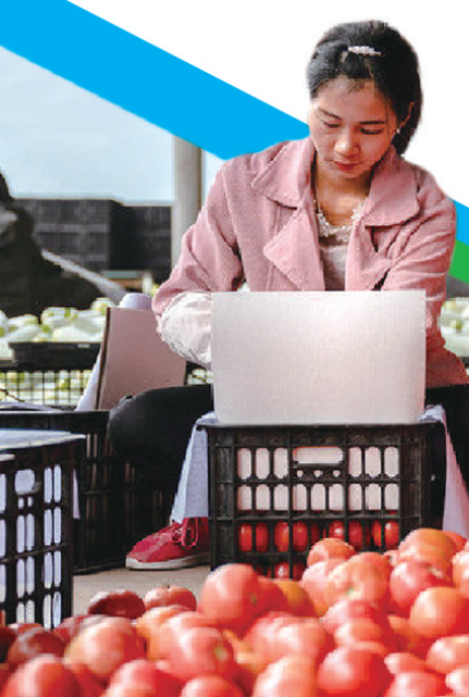
博白萝卜菜、荔浦芋头、罗平生姜、元谋番茄、三亚豇豆……借助“南菜北运”的广阔市

在海南省三亚市大茅村的奇幻世界共享农庄，水培蔬菜、众筹种植的火龙果以及亲子民宿吸引不少游客“打卡”。在这个农业产业化示范区带动下，当地村民人均年收入由2017年的8620元提高至2020年的2.15万元。