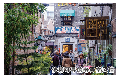
依稀可寻的老弄堂风情