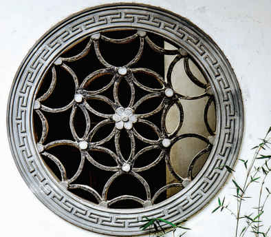
文字整理/摄影 杨清悦

在金山区横召村,记者看到两位老人不知在自己后院里忙着什么,上前一瞧才得知原来正在清理猪大肠,准备元宵节的丰盛晚餐呢!谈话间,记者被后院的各种盆景所吸引,桂花、梅花、腊梅、景观竹应有尽有。原来这里的男主人热爱园艺,除了这个后院,屋后还有个大棚种植着各类盆栽。配合着农家白墙黛瓦的建筑风格,这小院被点缀得颇具江南园林之味。文/报记者 杨清悦